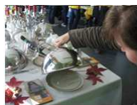
Erlebnistag „Umweltschutz schmeckt“